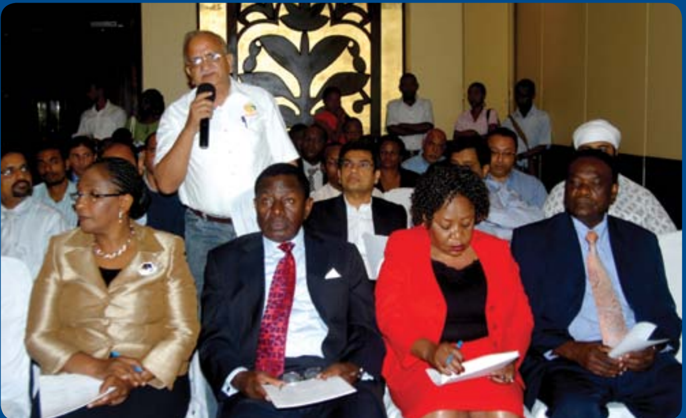
Mdau wa sekta ya petroli akizungumza kwenye uzinduzi wa Kamati ya Ufundi ya Mfumo wa Ununuzi wa Mafuta kwa Pamoja, mwezi Septemba 2011.