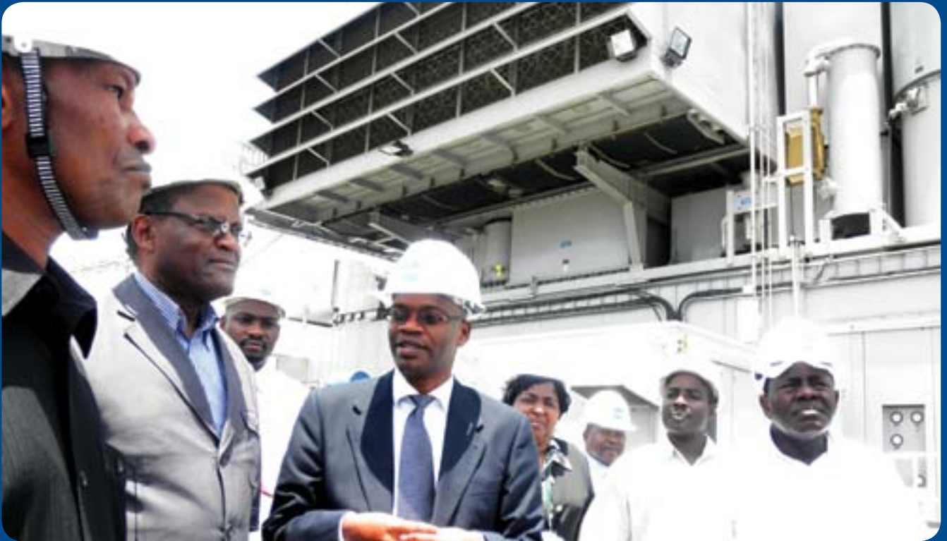
Wakurugenzi wa bodi ya EWURA wakipata maelezo kutoka kwa ofisa wa kampuni ya Symbion, walipotembelea mitambo ya kuzalisha umeme wa dharura jijini Dar es Salaam mwezi Septemba 2011.