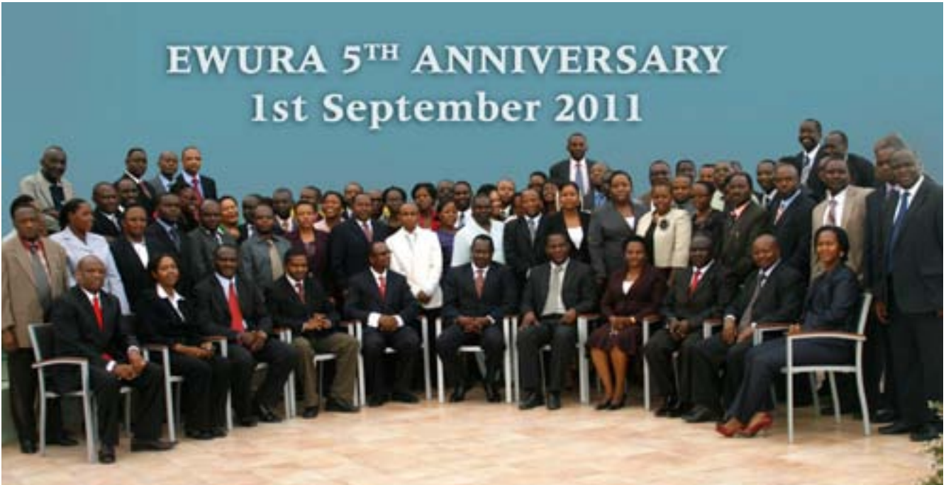
Wafanyakazi wa EWURA wakiwa katika picha ya pamoja Septemba mosi, 2011, walipoadhimisha miaka mitano tangu kuanzishwa kwa EWURA, Septemba 2006. Umma sasa unatambua kazi na wajibu wa mamlaka