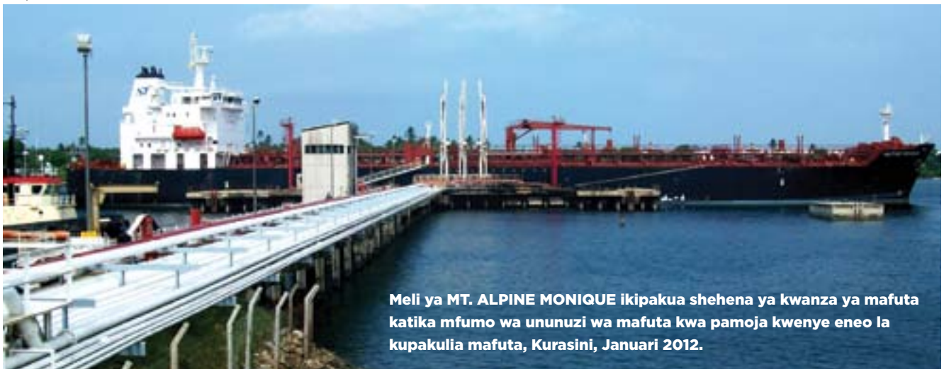
Meli ya MT. ALPINE MONIQUE ikipakua shehena ya kwanza ya mafuta katika mfumo wa ununuzi wa mafuta kwa pamoja kwenye eneo la kupakulia mafuta, Kurasini, Januari 2012.