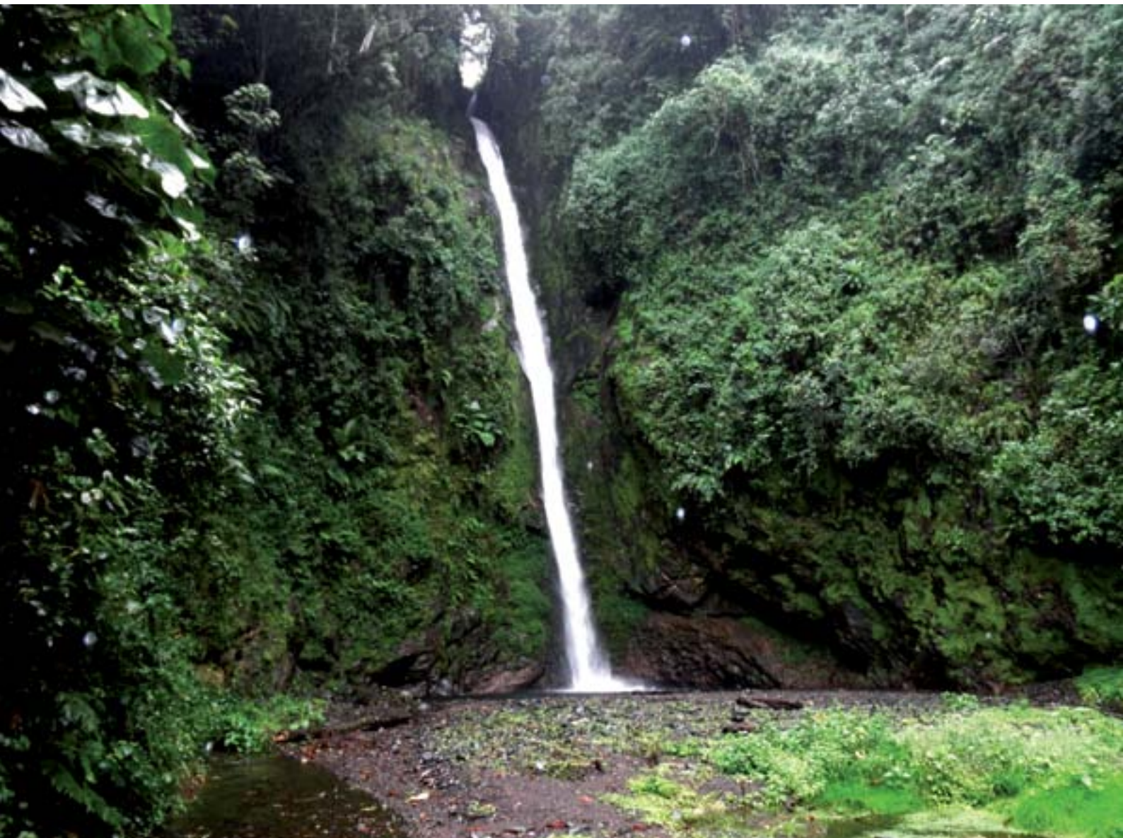
Maporomoko ya maji kwenye mto Nduruma, moja ya vyanzo muhimu vinavyotoa huduma ya maji kwa wakazi wa Arusha.

Ili kujihakikishia upatikanaji wa maji toka kwenye vyanzo vyake ambavyo vingi viko wilaya ya Arumeru, ushauri ulitolewa kwamba AUSA iangalie uwezekano wa kupanua eneo la kutoa huduma ili kuhudumia maeneo ambayo kuna vyanzo vya maji yake.