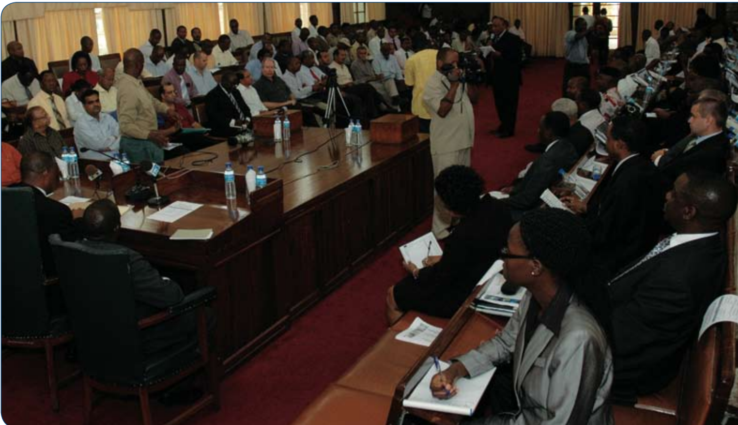
Watoa huduma na walaji wakihudhuria mkutano wa taftishi juu ya masuala ya mafuta.

EWURA haitaruhusu watumiaji kutumia vibaya mchakato wa kisheria na mara zote itaendelea kuzingatia majukumu yake ya dhati ya kuhakikisha taaluma ya hali ya juu inatumika na huduma zinatolewa kwa wakati ikiwa ni pamoja na kutatua migogoro kwa wakati muafaka. Kwa kufanya hivyo, Mamlaka, pamoja na mambo mengine, inazingatia kanuni muhimu ya utawala wa sheria, ambayo inasema, kuchelewesha haki ni kunyima haki.