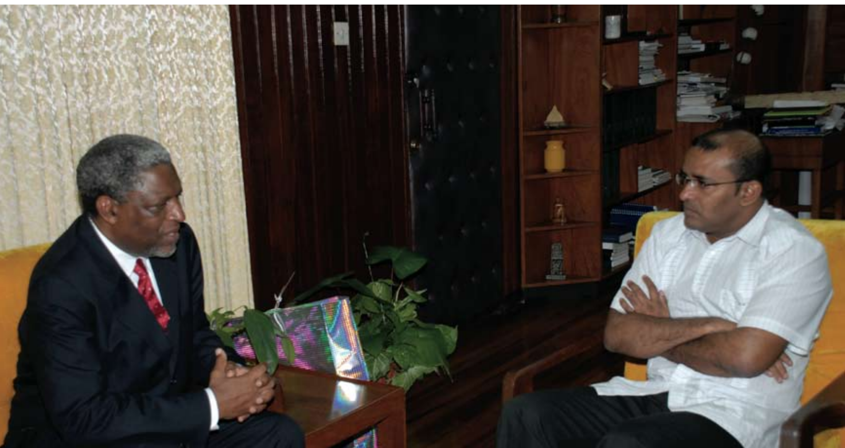
Rais Bharrat Jagdeo wa Guyana (kushoto) akijadiliana na Waziri wa Maji na Umwagiliaji, Mheshimiwa Profesa Mark Mwandosya mjini Georgetown-Guayana Septemba 2009.

EWURA inadhibiti sekta muhimu sana kwa uchumi wa Tanzania. Sekta hizo ni maji safi na maji taka, umeme, mafuta ya petroli na gesi asilia. Maji in muhimu sana kwa maisha ya viumbe. Umeme ni muhimu kuwaangazia watu na shughuli mbalimbali za kimaendeleo. Mafuta ya petroli ni muhimu kwa sekta ya usafirishaji na kuendeshea mitambo mbalimbali. Gesi asilia inasaidia sana katika uzalishaji wa umeme na kuwa chanzo cha nishati kwa baadhi ya viwanda kama kiwanda cha saruji n.k. Sekta hizi ni muhimu sana na udhibiti wake unatakiwa kufanywa na watu wenye uwezo na waliopatiwa mafunzo ya kutosha, vinginevyo uchumi wa nchi unaweza kuwa katika hatari kutokana na udhibiti usio makini.