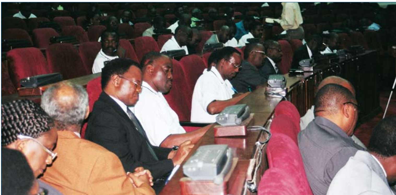
Ukumbi wa Msekwa ulikuwa umejaa wabunge wenye shauku ya kujua shughuli za EWURA.

Waziri wa Nishati na Madini, Mh. William Ngeleja alipongeza ufafanuzi wa Mh. Mwandosya.