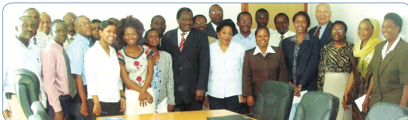
Wafanyakazi waanzilishi wa EWURA wakiwa katika picha ya pamoja mwaka 2006.

Hivyo kwa kuhitimisha, nataka kuipongeza familia ya Ewura kwa kuonesha utendaji mzuri wa udhibiti katika kipindi hicho cha miaka mitatu iliyopita. ALUTA CONTINUA!