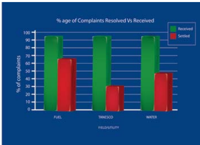
JEDWALI 1 - Malalamiko yaliyopokelewa vs yaliyoshughulikiwa

Jedwali 1 hapo juu linaonesha asilimia ya malalamiko