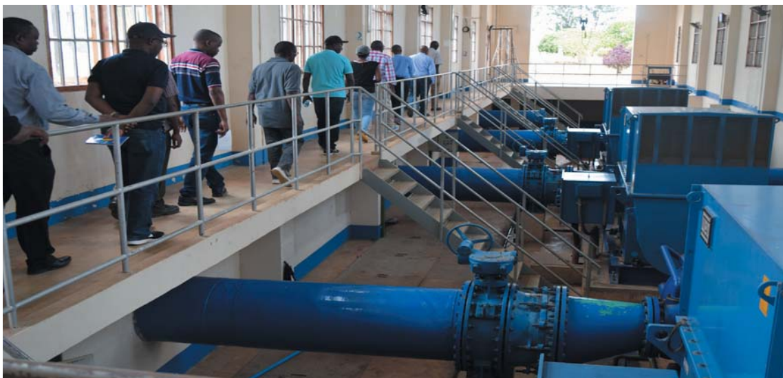
Ujumbe wa Bodi ya EWURA ukikagua miundombinu ya Mamlaka ya Maji na Usafi wa Mazingira za Kahama-Shinyanga KASHWASA. KASHWASA imeibuka kuwa moja ya mamlaka bora za maji nchini kwa mwaka 2018/19.

Ripoti ya utendaji inayotokana na mapitio hayo ipo katika tovuti ya EWURA www.ewura.go.tz .